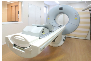
●シーメンス社製 SOMATOM Definition

当クリニックのデュアルソースCTは64スライスCTの管球を2台搭載しており、動いている心臓をより鮮明に見ることができます。撮像されたCTデータは、10分程度で、3-D画像に再構成されます。3-D画像とMPR画像という特殊な断面で、冠動脈の内腔の狭窄度と、 心臓カテーテル検査では見ることができない冠動脈壁プラークの性状までを診断することができます。